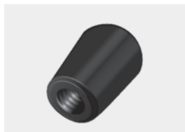
met inwendig draad