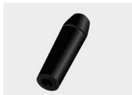
met doorlopend gat