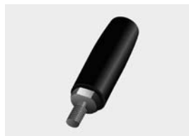
met uitwendig draad