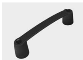
met inwendig draad