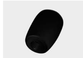
met inwendig draad