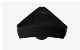
met inwendig draad