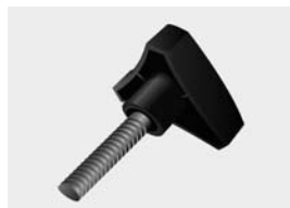
met uitwendig draad